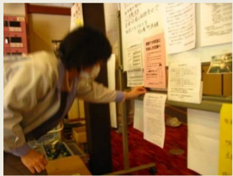
役場・避難所・災害FMを訪問 →掲示や回覧、毎日アナウンスなどしていただいた